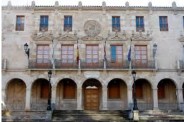
Ayuntamiento de Soria